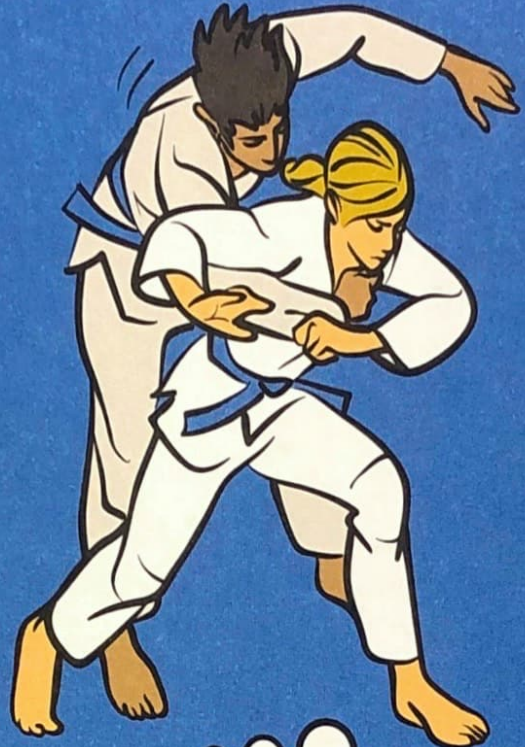
● ● ● Soto-makikomi