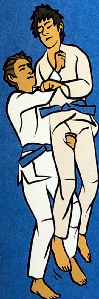
● ● ● Te-guruma (Sukui-nage)