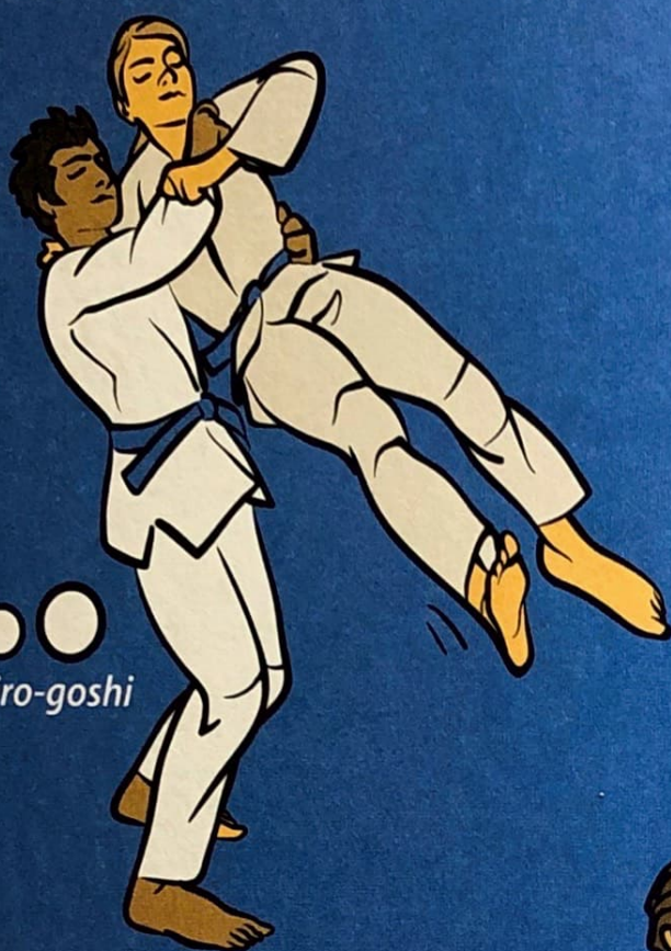
● ● ● Ushiro-goshi