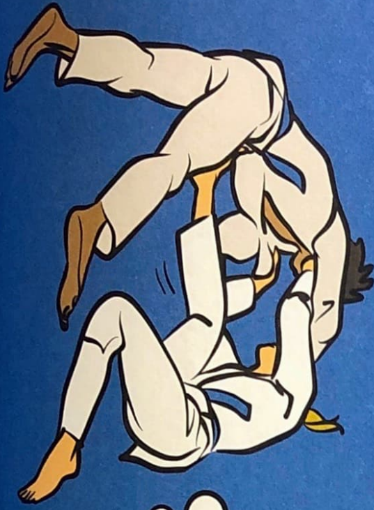
● ● ● Tomoe-nage