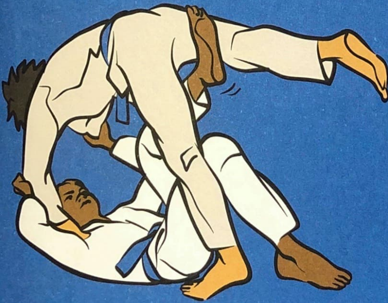
● ● ● Sumi-gaeshi