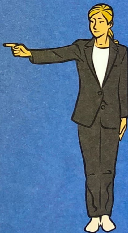
Donner une pénalité