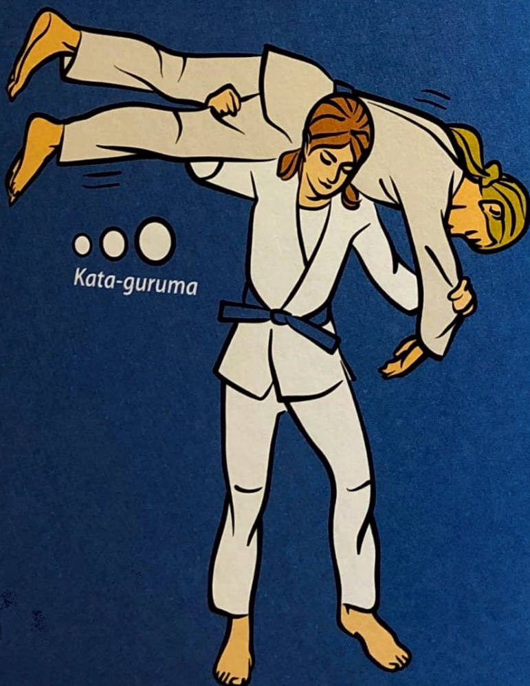
● ● ● Kata-guruma